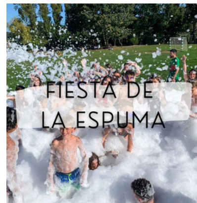
FIESTA DE LA ESPUMA

9.00 ¡Todos arriba! 9.30 Desayuno 🍴🍷 10.30 Actividades, talleres, gymkanas,... 12.30 Piscina 13.30 Comida y Tiempo Libre 🍴🍷 15.30 Actividad de interior 16.45 Merienda 🍴🍷 17.15 Juegos acuáticos y piscina 19.30 Aseo y Tiempo Libre 20.30 Cena 🍴🍷 21.30 Velada nocturna y discoteca 23.00 Hora de dormir